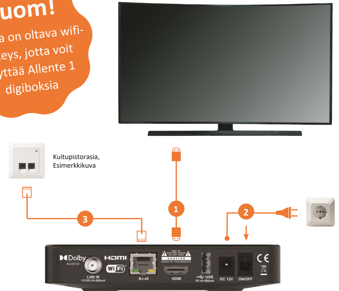
Allente 1 digiboksi

Sinulla on oltava wifi-yhteys, jotta voit käyttää Allente 1 digibokseja