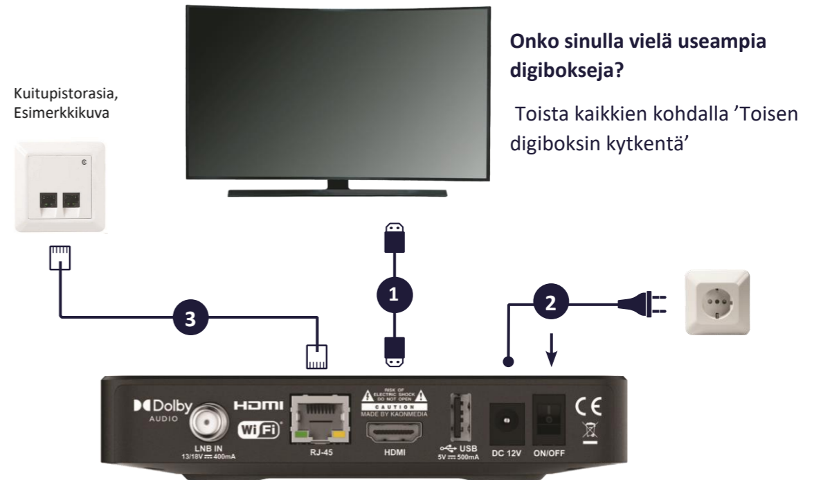
Allente 1 digiboksi (toinen digiboksi)